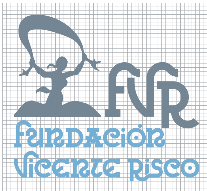
Imagotipo con acrónimo