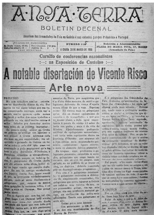
A notable disertación de Vicente Risco. Arte nova. Primeira plana de A Nosa Terra, 20 de marzo de 1920.

A Arte sempre fora motivo de afirmación, coñecemento e ledicia para Risco. Era un dos seus temas mais queridos, e motivo de constante aprendizaxe. O interese nos novos movementos (e o seu espallamento) era para el algo primordial na vida. Non só por unha cuestión de educación, formación e cultura senón polo que tiñan de sintomáticos. É lendario o seu vínculo coas Vangardas Históricas, coas que fixo pedagogía en ligazón á arte e á sociedade galega. El deu a interpretación de todo o novo que a cultura galega podía -debía- dar ao mundo dende a súa orixinalidade, a súa herdanza histórica, a atmosfera da súa natureza, o seu espírito e o extraordinario que descansa nas festas, os relatos e os mitos. Un dos maiores exemplos disto é o seu artigo Cosmopolitismo e universalismo publicado en A Nosa Terra o 25 de Agosto de 1919.