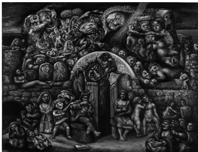
Trasmundo . 1946. Laxeiro. Técnica: Óleo sobre lenzo. Medidas: 138,5 x 178 cm. Da colección Fundación Laxeiro, Vigo. Museo Reina Sofía, Madrid.

Tamén Risco fora a personalidade coa cal a arte galega se abriu a temas artísticos inéditos ata entón. A representación artística do transcendental na cultura popular non tería tido a luz de non ser porque, sendo un grande etnógrafo, pescudou, documentou, rexistrou e levou a cabo publicacións centradas na antropoloxía galega. Foi así como moitos artistas que o coñecían, sentíronse inspirados por el para plasmar paisaxes que son Historia ou figuras que son valores. Cómo se non podería ter feito Laxeiro unha obra como Carnavalada (1931) ou Trasmundo (1946)? De tal xeito este retrato de Vicente Risco, por Laxeiro, condensa en si mesmo unha parte fundamental da nova arte galega.